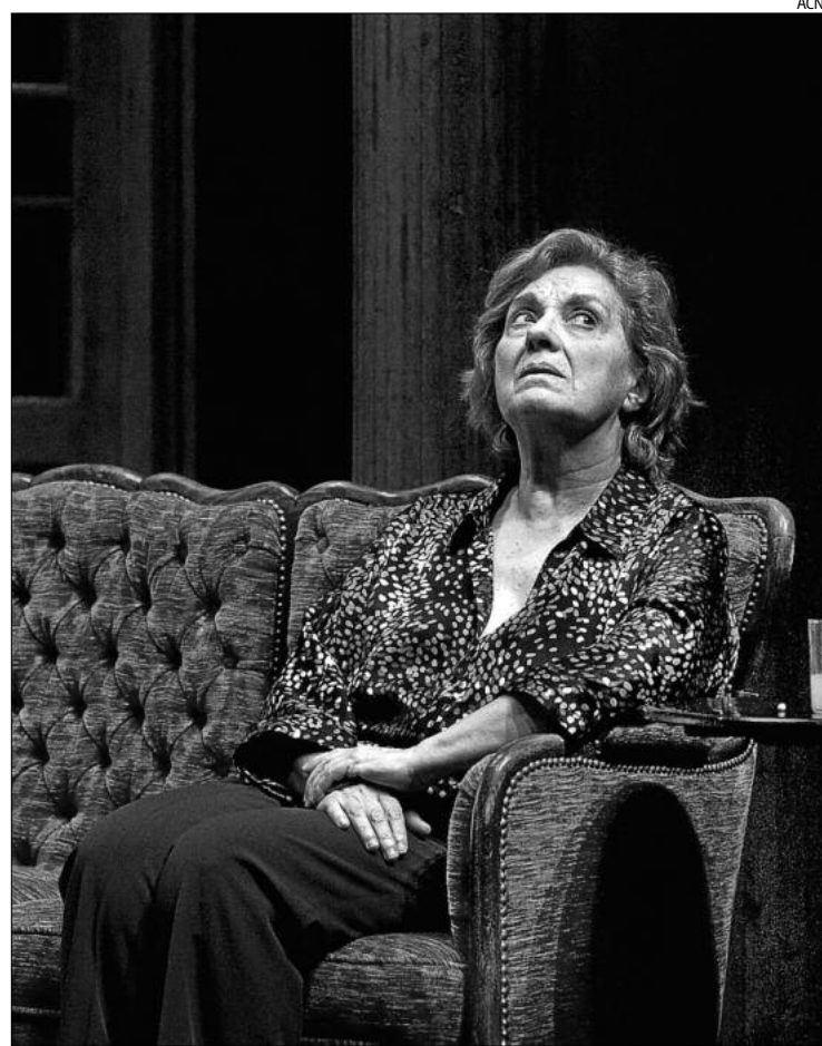
L'actriu esparreguerina va representar prop de quaranta obres

► Anna Lizaran ha estat una actriu que ha deixat una gran empremta amb papers memorables per als espectadors catalans i que gràcies a ells ha rebut nombrosos premis al llarg de la seva carrera. De fet, a la llista de guardons destaquen els vuit premis Butaca per obres com Forasters , El ball i Agost , el Premi Gaudí a millor actriu per Forasters i el premi Max per Tot esperant Godot . El seu primer guardó el va rebre l'any 1982, i va ser el Premi Margarida Xirgu de teatre. D'altra banda, l'actriu catalana també ha aconseguit el Premi Nacional de Teatre l'any 2003, el Premi Nacional del Ministeri de Cultura el 1984 i la Creu de Sant Jordi l'any 2000.