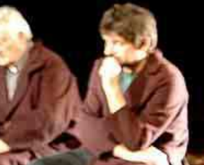
Una escena de 'El cercle de guix caucasià', que presentó en el Teatre Nacional en 2008.